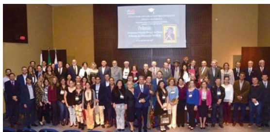
Em 7 de outubro de 2017 por ocasião do II Encontro Estadual de Professores de Direito, a OAB/PR instituiu o Prêmio de Boas Práticas de Educação Jurídica Aloísio Surgik